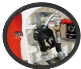
PISTOLA AUTOMATICA ANTICHISPA