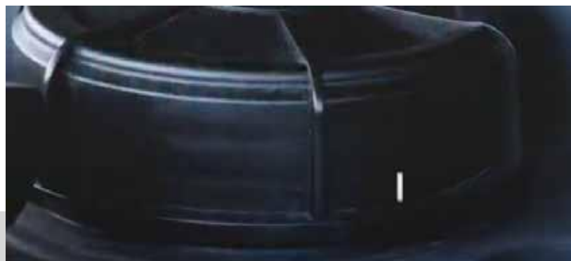
Válvula de prevención de sobrellevado calibrada para interrumpir el flujo de combustible al 90% del volumen del tanque.