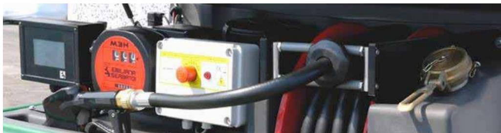
Cuadro eléctrico con botón de emergencia