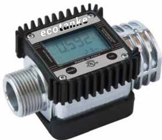
Indicador de volumen