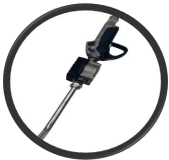
PISTOLA AUTOMATICA ANTICHISPA