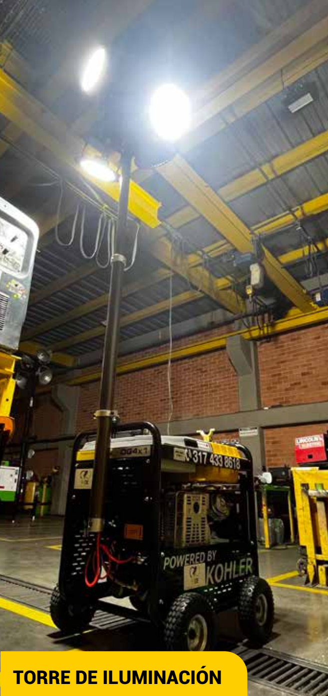
TORRE DE ILUMINACIÓN