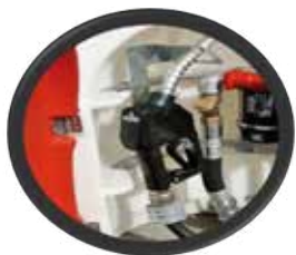
PISTOLA AUTOMATICA ANTICHISPA